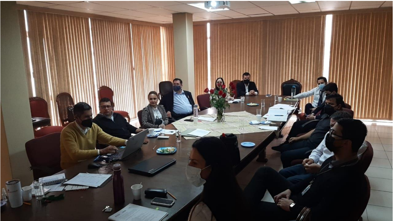
TALLERES DE TRABAJO CON ASISTENCIA TÉCNICA DE LA STP – REVISIÓN Y ACTUALIZACIÓN DEL PEI DE LA VICEPRESIDENCIA DE LA REPÚBLICA - Septiembre / Octubre 2021